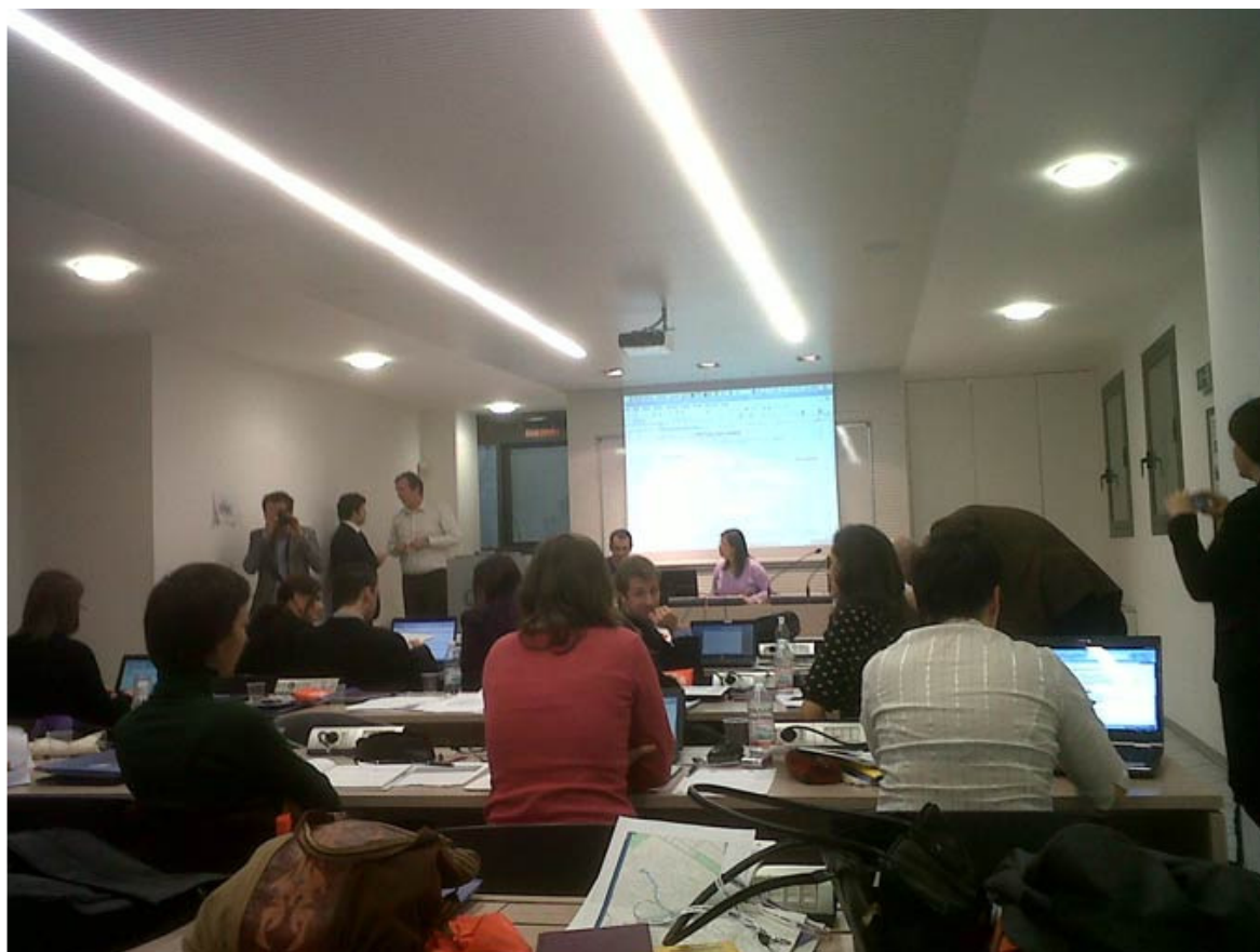
Redakcja - informacja przekazana przez DCIZiDN w Wałbrzychu